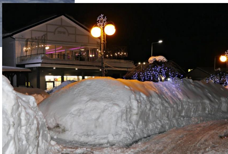
Zima styczeń 2019